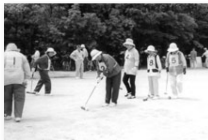
市民ゲートボール大会

●西河原公園グラウンド 第34回市民ゲートボール大会 11/20 9:20～ (雨天の場合23日) スポーツ振興課 626-3821