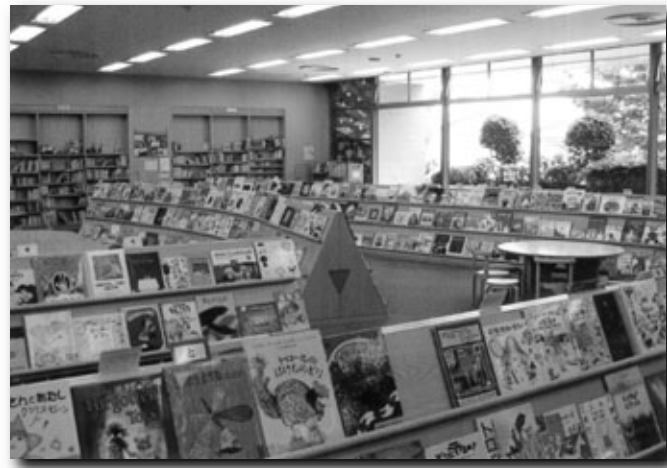
中央図書館 児童室

図書館では、貸出業務のほかにさまざまな業務や取り組みをしています。今回はその中のいくつかを紹介します。