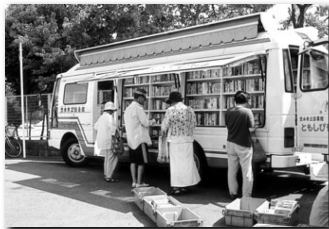
移動図書館“ともしび号”

図書館から遠い地域には、移動図書館“ともしび号”が担当の司書とともに巡回します。現在、自治会などの協力で23カ所に出向き、小説、実用書、子どもの本、絵本など約4,000冊を選択して積み込み、貸し出しをしています。