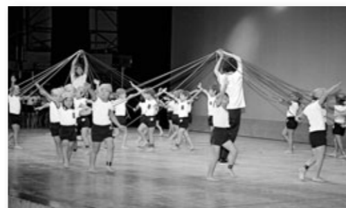
教育月間中央大会 第2部 発表と交歓

⑦福祉文化会館 第21回英語スピーチ大会 11/3 13:00～17:00 市民活動推進課 620-1604