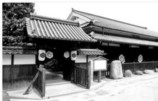
史跡 郡山宿本陣(樅の本陣)

●史跡 郡山宿本陣 秋の特別公開 11/6～21 9:30～16:30 (月曜・火曜は休館) 生涯学習課 620-1686