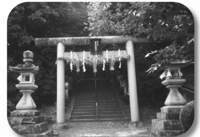
新屋坐天照御魂神社

鉢伏自然歩道は行程も短く、なだらかな自然の山道が多いので、家族で山歩きの楽しさを味わうことができます。