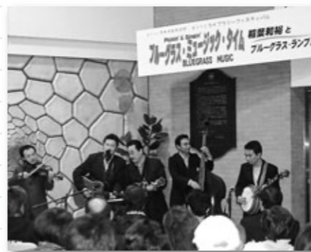
ライブラリーフェスティバル