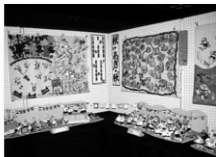
市立幼稚園・小学校・中学校総合展

第47回市立幼稚園・小学校・ 中学校総合展 11/13～15 9:30～16:30 (15日は12:00まで) 学校人権教育課 620-1683