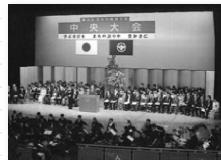
教育月間中央大会 第1部 式典