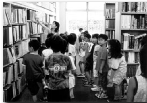
小学生の館内見学風景

茨木市では、小学校3年生の時に中央図書館を見学します。その時全員が利用カードを作り、借りて帰ります。茨木市の図書館の利用率が高い理由の一つには、こうした子どもの時からの体験が活かされているのかもしれない。