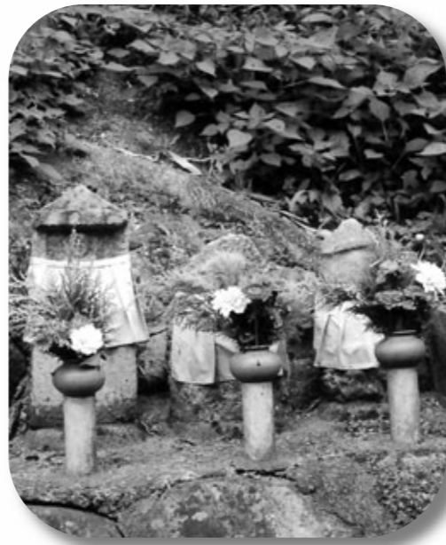
免山入り口近くにある地藏仏

のどかな梅原集落を後に、田園風景の中を山手へと進み、左折してヒノキの林道を少し行くと、小さな池と平地が目の前に開ける。このあたりからウグイスの音が聞こえ始め、その鳴き声にしばし聞き惚れる。ヒノキ林と大きな樹木のなだらかな山道を、体にマイナスイオンを浴びながら30～40分歩き、少し急な山道を登ると、標高296mの鉢伏山山頂に着く。茨木市南西部の眺望が開け、ゴルフ場なども見渡せる。山頂には昭和6年建立の登頂記念碑がある。記帳ノートがあったので記念に記帳して下山する。