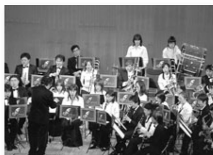
茨木市吹奏楽団オータムコンサート

④中央公民館 第27回茶華道展 10/15～17 華展 10:30～17:00 (17日は16:00まで) 茶席 10:30～16:00 (17日は15:30まで) 生涯学習課 620-1686