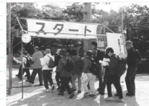
市民ウォークラリー大会

⑩中央公園北グラウンド 第13回市民ウォークラリー大会 10/17 9:15～ (雨天決行) スポーツ振興課 626-3821