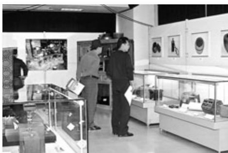
文化財資料館テーマ展

第12回市民スポーツフェスティバル 11/21・23 9:00～16:00 ※会場は他にもあります。 スポーツ振興課 626-3821