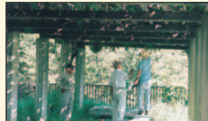
藤棚を点検する大工班