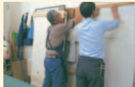
ふすまの張り替え