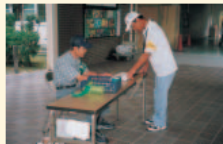
学校での受付業務