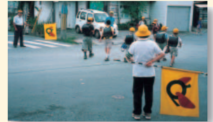
通学路に立ち児童を誘導する会員