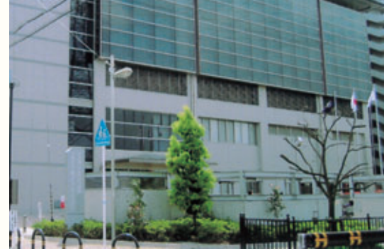
茨木東スポーツクラブ-レッツ (茨木市立東市民体育館)

生涯にわたってスポーツを楽しむことは、私たちの健康に役立ちます。 「茨木東スポーツクラブ-レッツ」は、すべての人たちが、スポーツのある暮らしを楽しむことができるように設立された新しいタイプのスポーツクラブです。