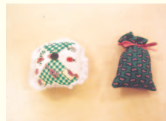
ピンクッションとサシェ

好みのポプリを小さな布に入れます。それがサシェ（匂い袋）です。玄関や車の中、ロッカーなどにもおすすです。