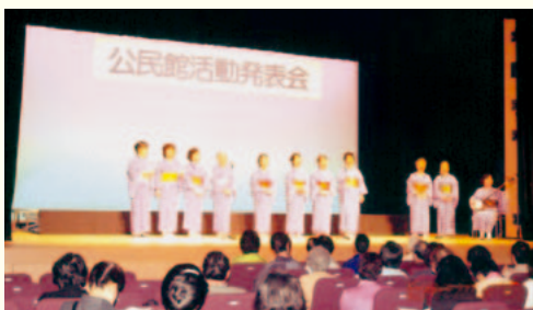
公民館活動発表会での「民謡唄桜会」の皆さん（平成19年2月に生涯学習センターで開催）