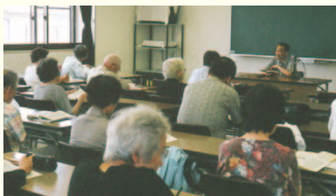
養精地区公民館での日本文学講座（『徒然草』を解説する講師とそれを熱心に聞く受講生）

公民館の使用は、グループを登録団体として申し込む場合とそうでない場合とでは、提出書類や申し込み期間などが違ってきますので、お近くの公民館にお問い合わせください。グループ登録は、原則として10人以上で半数以上が市内在住、在勤、在学していること。使用料は、午前・午後・夜間に分かれ、部屋に応じて400～650円です。