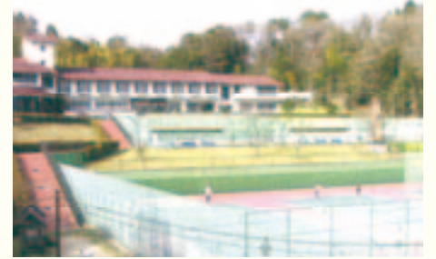
忍頂寺スポーツ公園 テニスコート

茨木市では、市民が楽しく運動できるように市内の施設にさまざまな機器や道具を設けています。プールの開場も始まり、夏のスポーツまっさかりですが、忍頂寺スポーツ公園や市民体育館でも、個人利用できるスポーツ施設があります。お友達や家族といっしょに楽しんでみませんか。