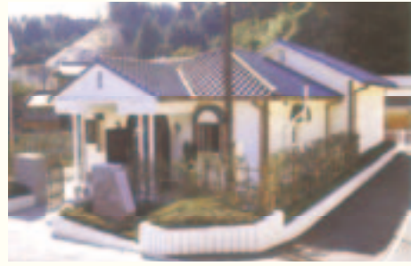
キリシタン遺物史料館