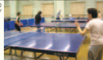
市民体育館で卓球を楽しむ市民