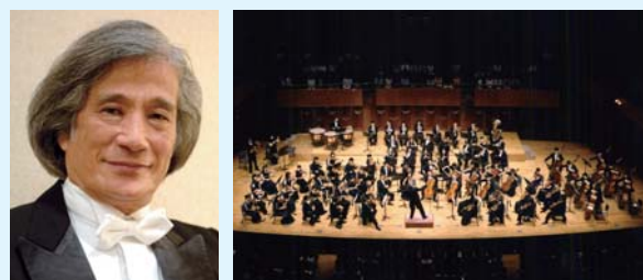
指揮:飯守泰次郎 関西フィルハーモニー管弦楽団