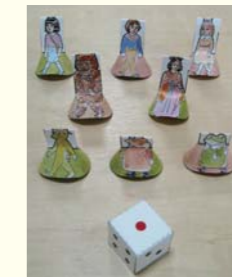
回り札とサイコロ