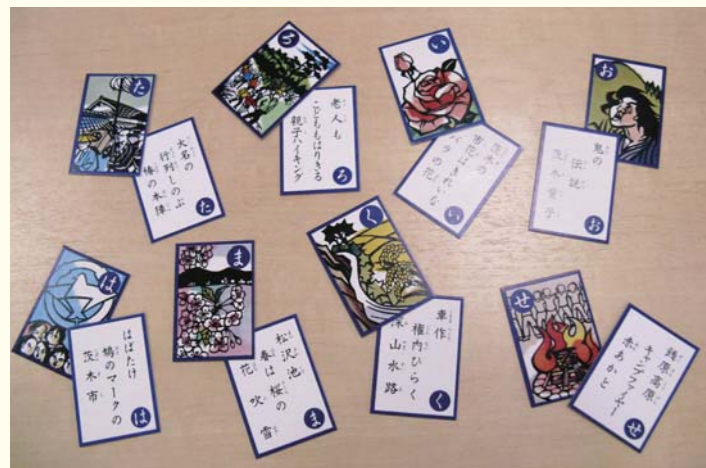
「いばらきの郷土かるた」

「いばらきの郷土かるた」は、昭和47年(1972年)からの3年間に、茨木市内の小学4年生以上の児童の皆さんから送られてきた2,485の句を、審査選定委員の先生方が選出し、昭和51年(1976年)に発行されました。絵と装丁は加藤義明先生です。昭和60年(1985年)に、現状にそぐわなくなった句を検討委員の先生方が一部変更し、改訂・再版されました。読み札の内容は、茨木市の史跡、歴史、施設、人物などです。遊び方は自由ですが、団体戦で遊ぶ場合は、かるたの箱の中に、人数、読み方、札の位置、採点方法などを示した用紙が入っていますので、それを参考にして楽しんでください。(価格：600円)