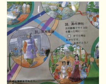
すごろく版を拡大した一部