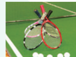
バウンドテニスのラケット

テニスの面白さを小さいコート（幅3メートル、縦10メートル）に凝縮したスポーツです。動く範囲はテニスに比べて圧倒的に小さく、足腰への負担も少ないため、体力や年齢に応じたプレースタイルが可能です。