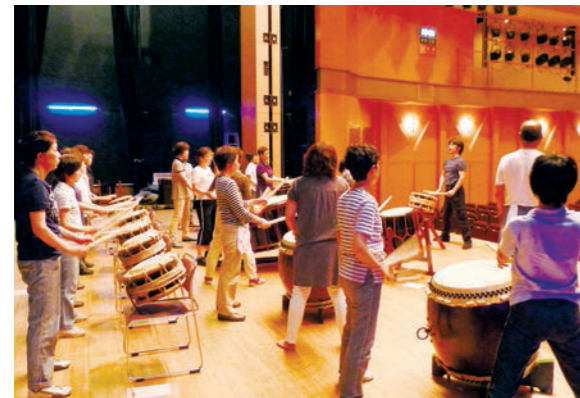
きらめきホールでの練習風景