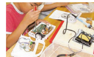
親子電子ロボット工作教室