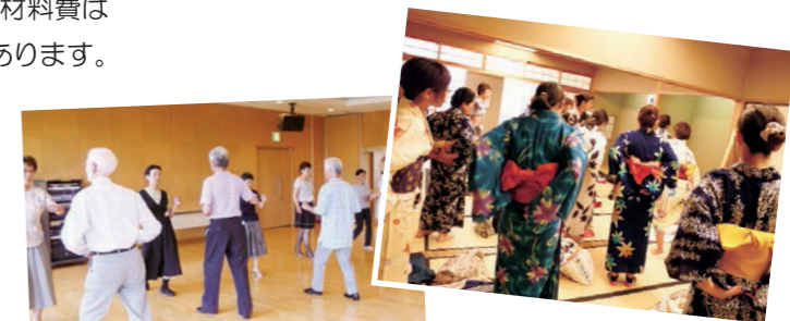
ゆかたの着付け 社交ダンスで足と腰を鍛えよう